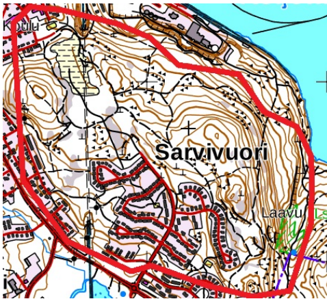
Kuva 1: Tempon ja normaalikilpailun kielletyt alue

Harjoittelukielto: SM-tarkkuussuunnistus 2.9.2019 saakka.