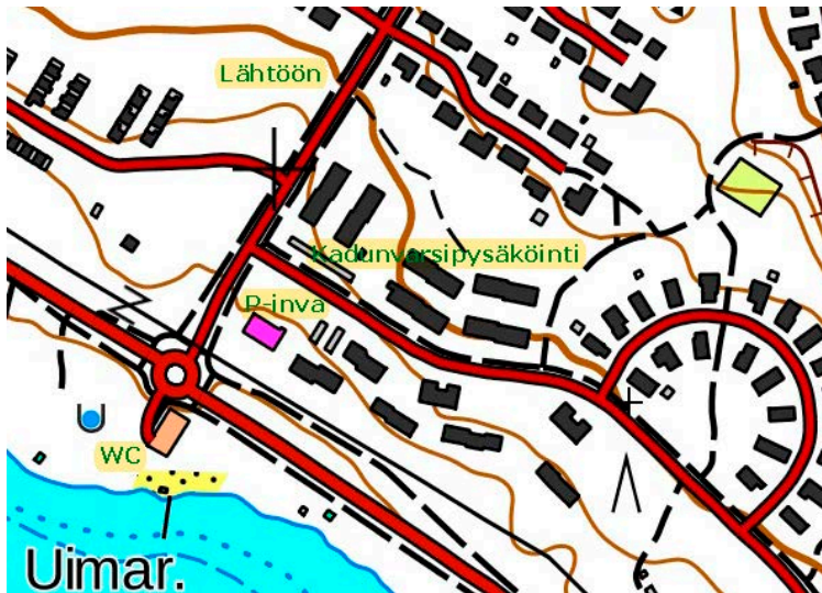
Kuva 3: Pysäköinti, tavallinen vessa, kävelytie lähtöön (pohjoiseen).

Ensimmäinen lähtö 10:00, väliaikalähtönä, emit ajanotto.